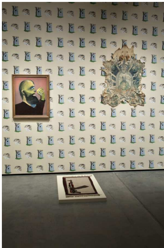
Gauche: Sidney Nolan, Colonial Head—Kelly Gang , 1943–46, sol: tapis de guerre afghan, droite: Wim Delvoye, Untitled (Osama), 2002–3, papier peint : Robert Gober, Hanging Man/Sleeping Man , 1989