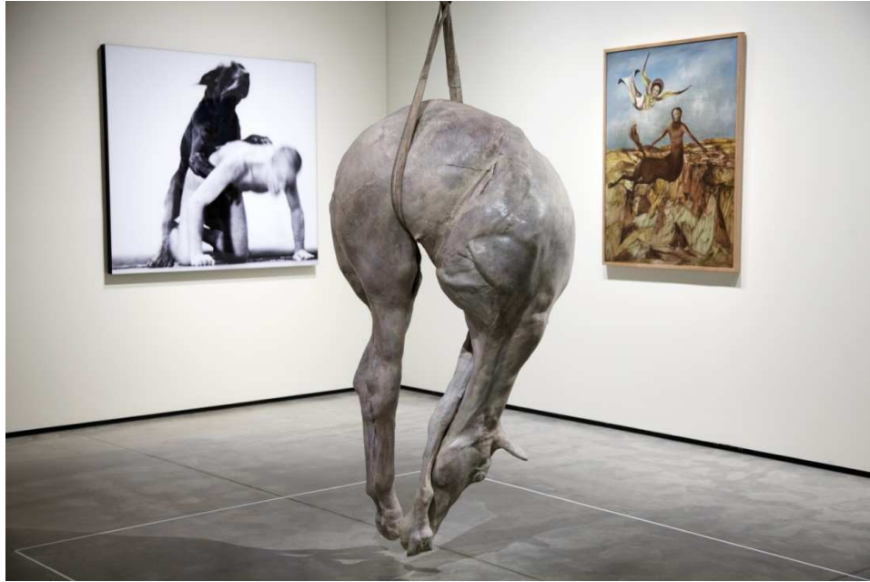
Gauche: Oleg Kulik, Family of the Future , 9, 1997, centre: Berlinde De Bruyckere, P.XIII , 2008, droite: Sidney Nolan, Centaur and Angel , 1952