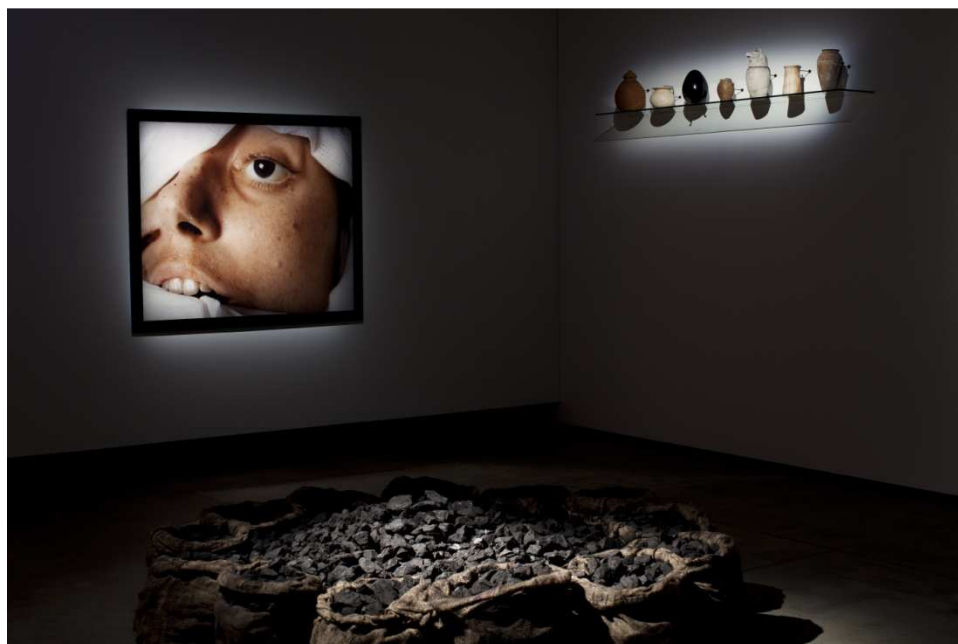
Gauche : Andres Serrano, The Morgue (Blood Transfusion Resulting In AIDS) , 1992, en haut à droite : divers objets et œuvres des collections du MONA et du TMAG, premier plan : Jannis Kounellis, 'Untitled' , 2012