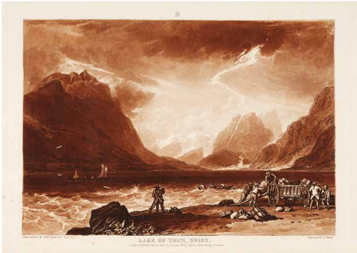
Joseph Mallord William Turner et Charles Turner, Lake of Thun, Swiss , 1808, gravure, pointe sèche et mezzotinte, Bibliothèque nationale suisse, Cabinet des estampes, GS-GRAF-ANSI-BE-216.

exposition du 24 septembre 2020 au 28 février 2021