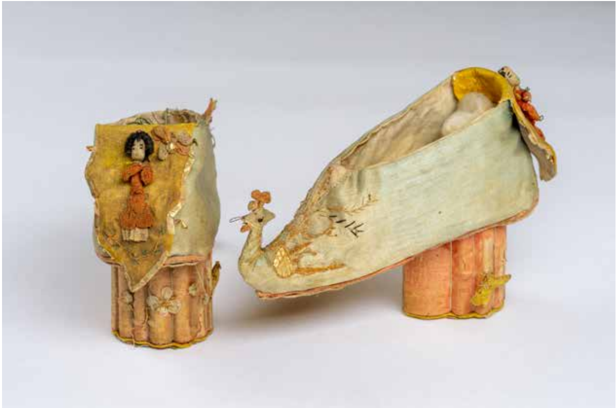
Auteur-e-s non-documenté-e-s (Chine ?), Paire de chaussures pour pieds bandés , appelée aussi Paire de chaussure de Lotus , collectée entre 1669 et 1682, collection Georg Franz Muller, St. Gall, Stiftsbibliothek, 16.

exposition du 24 septembre 2020 au 28 février 2021