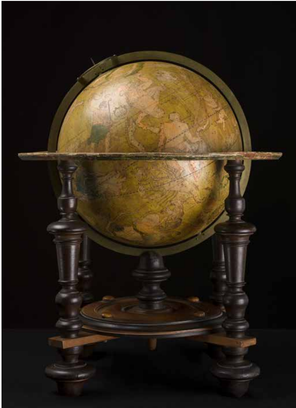
Auteur-e-s non-documenté-e-s (France, Europe), Globe céleste , 18 e siècle, collection Louis de Treytorrens, Bibliothèque cantonale et universitaire BCU Lausanne.

exposition du 24 septembre 2020 au 28 février 2021