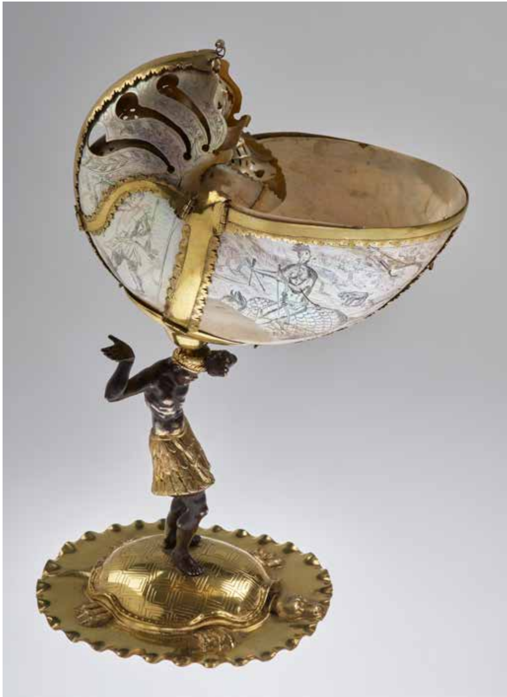
Frank Christian, Coupe navile , vers 1680, Ville de Genève, Musées d'art et d'histoire, don d'Anne-Catherine Trembley à la Bibliothèque publique de Genève, 1730, G 0937.

exposition du 24 septembre 2020 au 28 février 2021