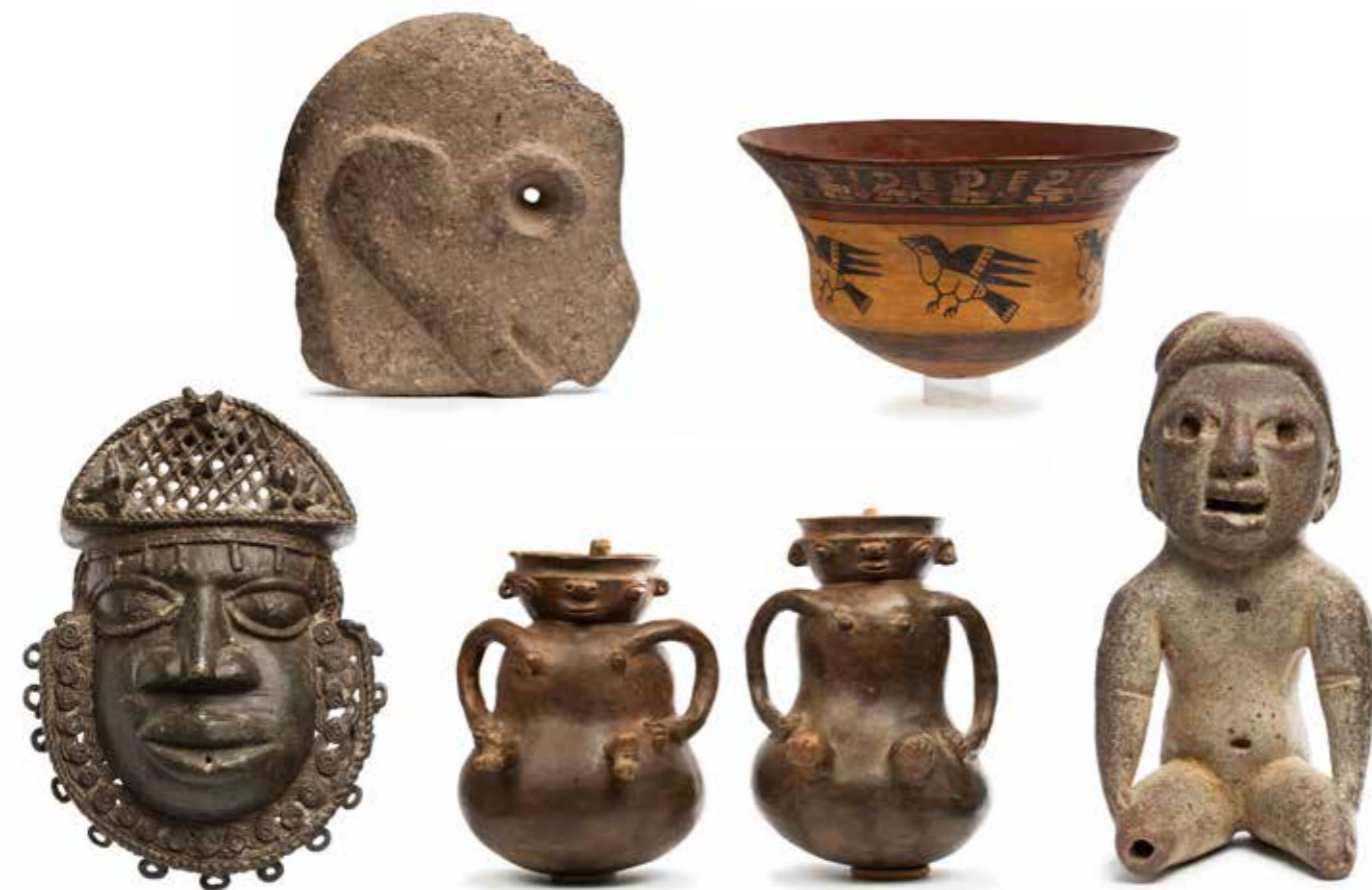
N. Hacha sculptée d'une tête de singe Maya du Guatemala, époque classique 600-900 ap. JC