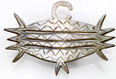
Parure de nez, île de Malaita ou Makira, 20 ème siècle

Particulièrement présentes, les parures corporelles et les monnaies sont liés à la vie culturelle, politique et rituelle. Réalisés à partir de matériaux complémentaires issus du monde de la forêt et du monde marin, leurs surfaces brillantes ou leurs couleurs vives donnent à voir pouvoir et prestige qui sont des valeurs fondamentales pour les sociétés des îles Salomon.