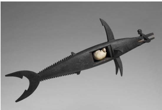
Poisson reliquaire île d'Owaraha (Santa Ana) Début du 20 e siècle

Comme ailleurs en Mélanésie, la perméabilité entre le monde des Morts et celui des Vivants est caractéristique des sociétés salomonaises . Dans les provinces occidentales et orientales, les reliquaires à crâne permettaient aux vivants de maintenir, au travers de rituels et d'offrandes, les relations avec les esprits des défunts, de les enrôler dans l'exécution des actions humaines et de contrôler ce pouvoir généré par leur passage à l'état d'ancêtre, appelé mana . Tridacne mat ou nautile irisé étaient choisis par les experts en sculpture pour matérialiser ces entités.