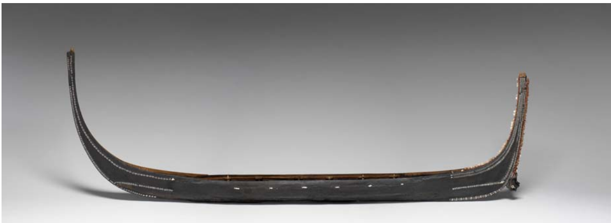
Modèle de pirogue de guerre, île de Nouvelle-Géorgie, fin du 19 ème siècle

Considérés comme une forme d'échanges réciproques de violence, les guerres, les expéditions de chasse aux têtes et les meurtres commandités étaient courants dans l'archipel, jusqu'à la pacification britannique imposée en 1893. Pirogues, sculptures élaborées - dont les célèbres nguzunguzu au visage prognathe marqueté de nacre de nautilaire -, armes et charmes magiques participaient de l'efficacité de ces pratiques prédatrices.