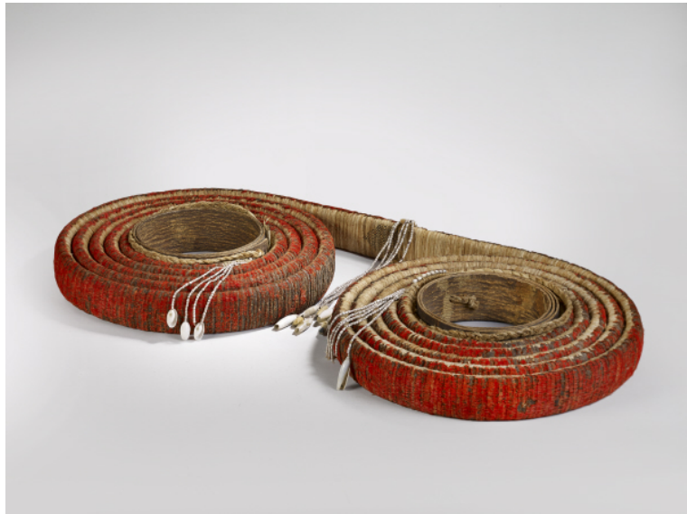
Monnaie de plumes, îles Santa Cruz, début du 20 e siècle