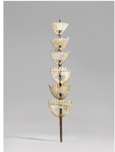
Charme île de Nouvelle-Géorgie Début du 20 ème siècle