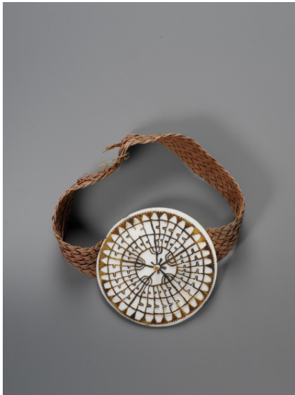
Parure frontale, dala îles Salomon orientales ou occidentales Début du 19 e siècle