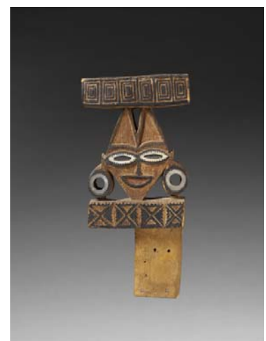
Sculpture de pirogue Île de Nouvelle-Géorgie, 19 ème siècle